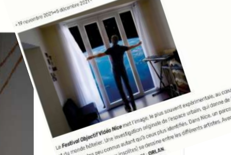
Le Festival Objectif Vidéo Nice met l'image, le plus souvent expérimentale, au cœur de la ville du monde hôte. Une investigation originale de l'espace urbain qui donne de la vidéo les visuels peu connus autant qu'à ceux plus identifiés.

Le Monde A Nice, le festival de vidéo OVNI s'étend et s'affirme Par Harry Bellot (Nice)