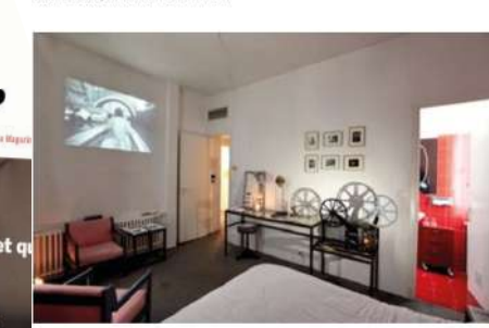
Festival OVNI - Hôtel Windsor - Friture ble gonflée, 2019, Alice Guitard, Galerie Eve Vautier & Jean-Marc Thevoz

The experimental video arts festival returns to Nice, this year adding new venues in and around the capital of the French Riviera.